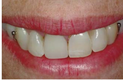
Çıkarılabilir Kısmi Protezler