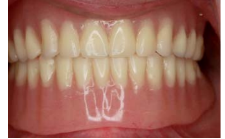
Komple veya Tam Protezler