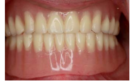
Komple veya Tam Protezler